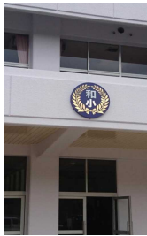
新しい校章 いします。

本日4月7日(金)に開校式、そして第1学期の始業式を行いました。子どもたちや教職員の緊張感とこれから始まる和氣小学校での生活への期待感が伝わってきました。和氣小学校の学校教育目標は「共に生き 共に学び 共に高まる」児童の育成です。変化の激しい時代の中で、様々な人と共生して、生涯にわたって学び続け、仲間を大切に、仲間とともに心も体も成長してほしいと願っています。これまで4校で大切にしてきた教育活動やその成果を1つのパワーにまとめて、新たな歴史と伝統を築いていきたいと思ひます。全教職員が全力を尽くして新しい学校づくりに挑戦していきます。保護者の皆さんや地域の皆さんには、本校教育活動へのご理解とご協力をよろしくお願ひします。